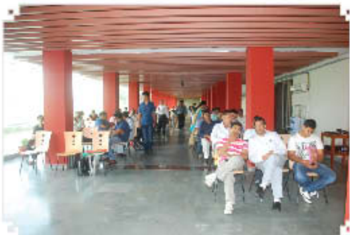
Counselling of students for admission