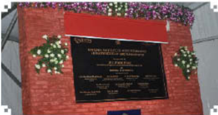
भारतीय कृषि एवं खाद्य प्रसंस्करण उद्योग मंत्री द्वारा उद्घाटन पत्र के उद्घाटन

संस्थान को राष्ट्र के प्रति समर्पित करते हुए माननीय कृषि एवं खाद्य प्रसंस्करण उद्योग मंत्री ने कहा कि संस्थान खाद्य उद्योग के लिए विशिष्ट उच्च गुणता शिक्षा तथा अनुसंधान कार्यक्रमों की पेशकश करेगा तथा कौशल की कमी को दूर करने के लिए अन्य महत्वपूर्ण क्रियाकलापों की व्यवस्था भी करेगा। उन्होंने आगे खाद्य प्रसंस्करण क्षेत्र की वौहिक आवश्यकताओं की पूर्ति हेतु निपटेम जैसी कई और संस्थाओं की आवश्यकता पर भी जोर दिया।