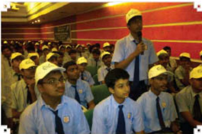
Outreach Programme at Ahmedabad