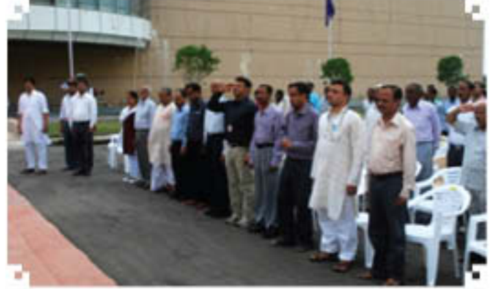
स्वतंत्रता दिवस को निपटेम का स्टाफ तथा विद्यार्थी