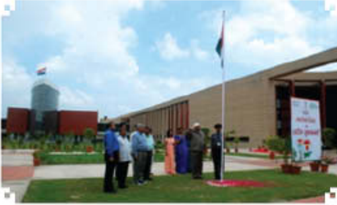
कारारोहण करते हुए निपटेम में उपकुलपति

कर्तव्यों तथा उत्तरदायित्वों का निर्वहन समर्पण, निष्ठा तथा पारदर्शिता से करने की सलाह दी। उन्होंने विद्यार्थियों को यह भी सलाह दी कि वे कठोर परिश्रम करें तथा उच्च प्रतिभावान अध्येता बनें किन्तु साथ ही देश के अच्छे नागरिक भी बनें।