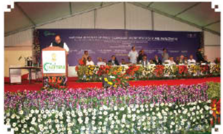
माननीय कृषि एवं खाद्य प्रसंस्करण उद्योग राज्य मंत्री श्री तारिक अनवर अपना भाषण देते हुए