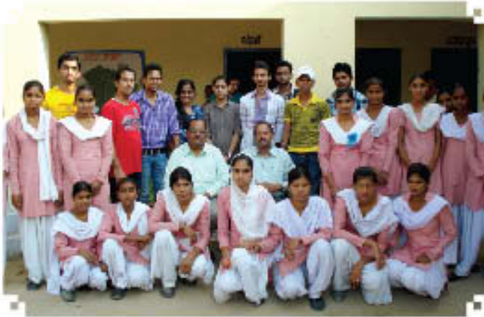
पंजाब में राष्ट्रीय महिला माध्यमिक विद्यालय, कैलाश