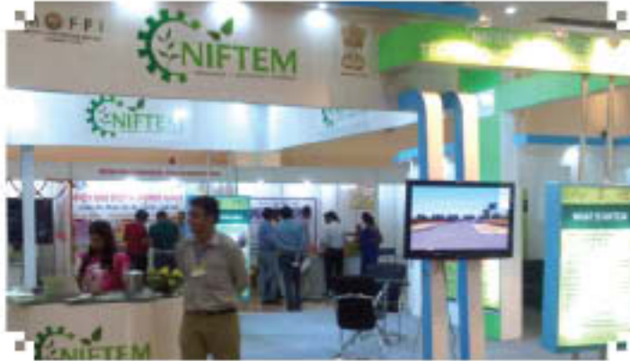
एमएसएमई एक्सपों, लखनऊ, उत्तर प्रदेश

में जय चंदी पट्टार महोत्सव तथा लखनऊ में एमएसएमई एक्सपों में भाग लिया ताकि खाद्य प्रसंस्करण क्षेत्र में प्रवेश करने हेतु विद्यमान तथा नए उद्योगों को सर्वाधिक तथा प्रोत्साहित किया जा सके।