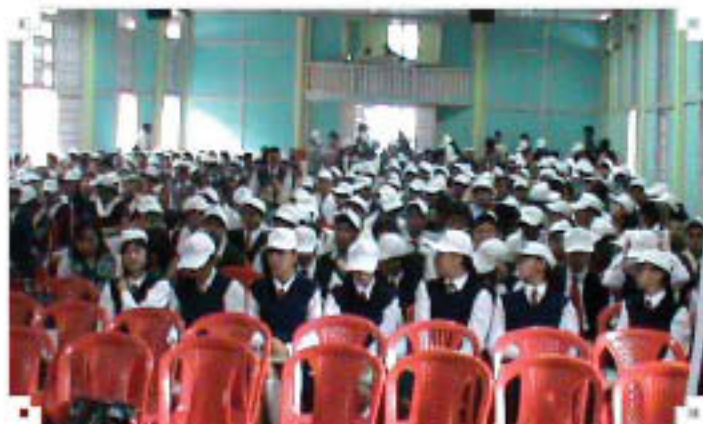
Outreach Programme at Shillong