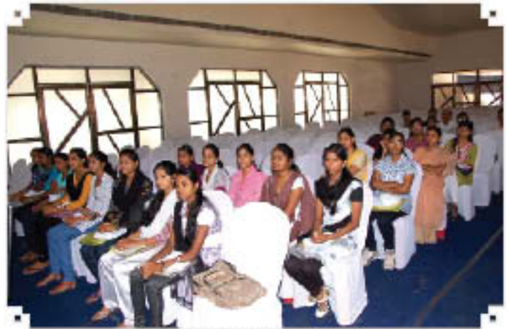
Outreach Programme at Ranchi