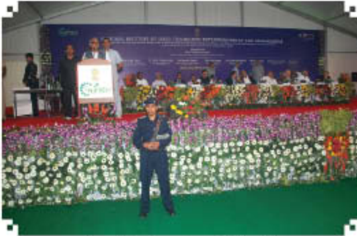
भारत के राष्ट्रपति के राष्ट्रीय मुख्यालय की मुद्रा, दिल्ली, हरियाणा

हरियाणा के माननीय मुख्य मंत्री ने इस प्रतिष्ठित संस्थान के लिए भूमि प्रदान करते हुए प्रसन्नता व्यक्त की तथा उन्हें हरियाणा राज्य में ऐसे शीर्षस्थ विश्वस्तरीय संस्थान की स्थापना होने पर गर्व था। माननीय मुख्य मंत्री ने संस्थान का प्रथम न्यूजलेटर भी जारी किया।