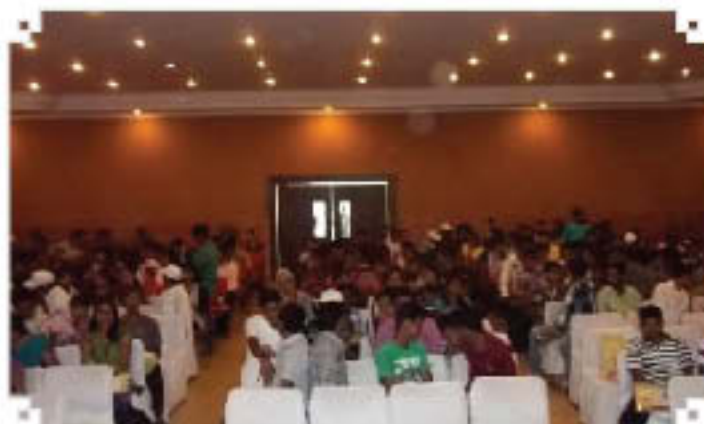
मुंबनेश्वर में आउटरीच कार्यक्रम