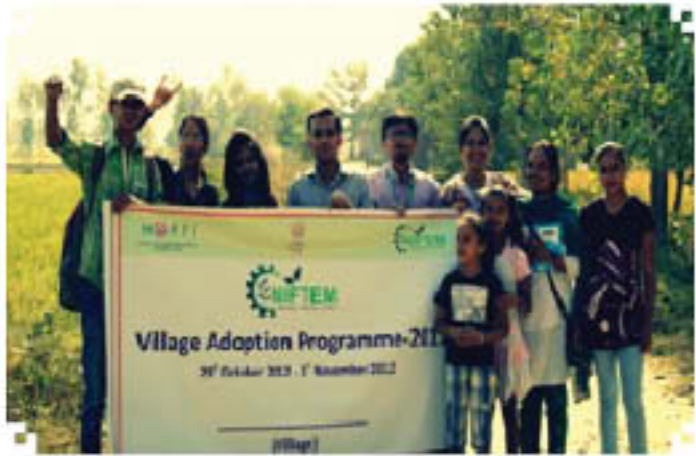
दुलाहापुरा, जयपुर, राजस्थान में निपटेम की टीम द्वारा बनाया पोस्टर (वी)