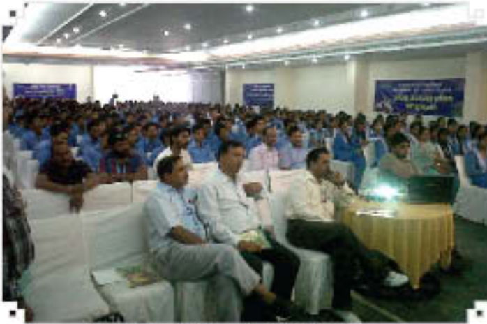
Outreach Programme at Dehradun