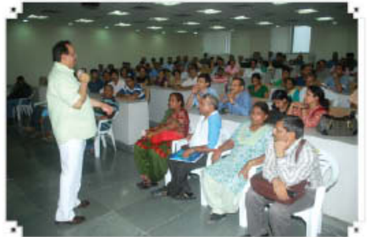
उप-कुलपति विद्यार्थियों तथा उनके माता-पिता को संबोधित करते हुए