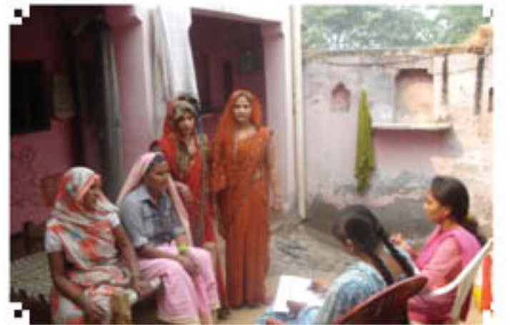
Students interacting with ladies in village Nagla Mohan, Uttar Pradesh