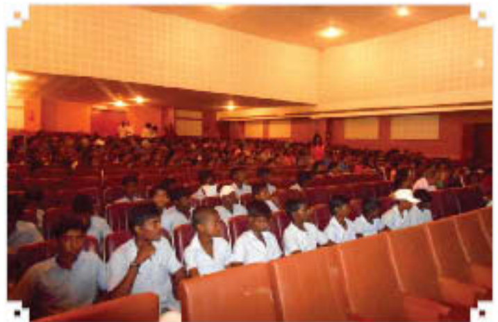
Outreach Programme at Bangalore