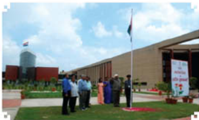
Vice Chancellor, NIFTEM Hoisting the National Flag

responsibilities with dedication, sincerity and transparency. He also advised the students to work hard and become high ranking scholars but simultaneously also become a good citizen of the country.