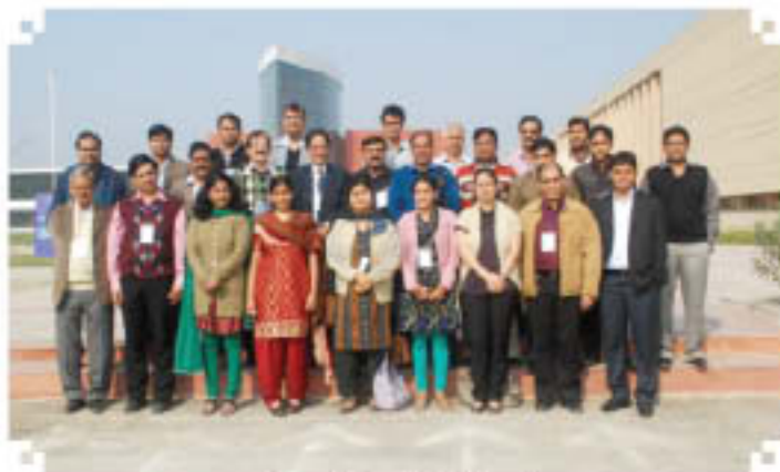
Group Photo of Participants (8-10 Dec., 2011)