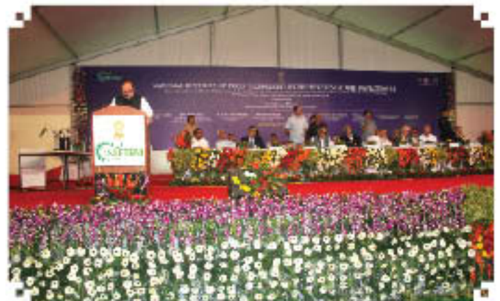
Shri Tariq Anwar, Hon'ble Minister of State for A&FPI delivering his address