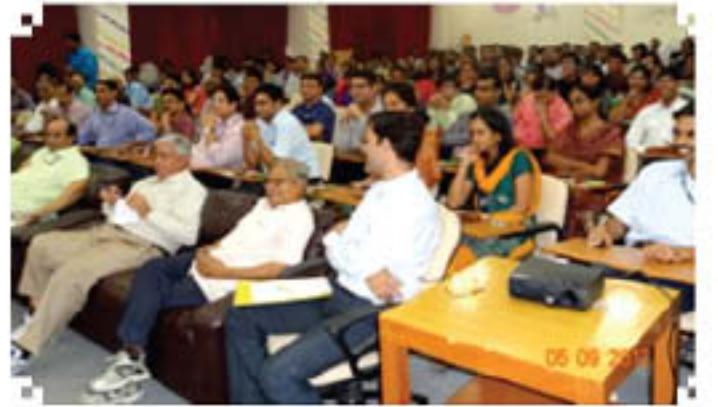
निपटेम में विद्यार्थी तथा अध्यापक