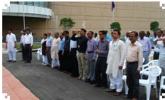
NIFTEM Staff & Students on Independence Day