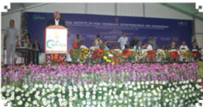
Shri Sharad Pawar, Hon'ble Minister of A & FPI Delivering Inaugural Address