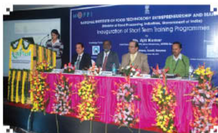
Inauguration Function (8 Dec., 2011)