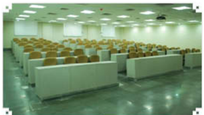
100 सीटों वाला कक्षाकक्ष