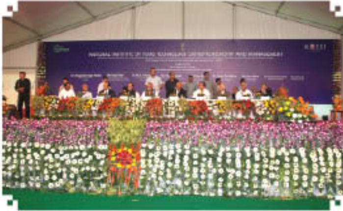
7 नवम्बर, 2012 को निफटेम परिसर का उद्घाटन