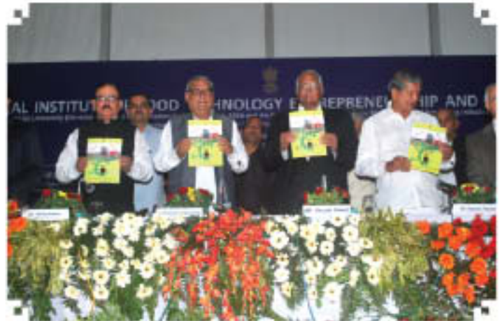
Hon'ble CM, Haryana releasing NIFTEM's 1st Newsletter

While dedicating the Institute to the Nation the Hon'ble Minister of Agriculture and Food Processing Industries has said that the Institute will offer high quality education and research programmes specific to the food industry and also provide other core activities to bridge the skill gap. He further emphasized the need for many more Institutions like NIFTEM to meet the intellectual requirements of Food Processing Sector.