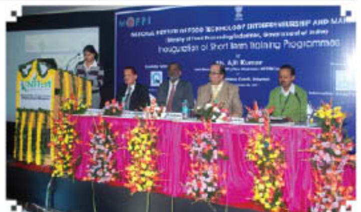
उद्घाटन समारोह (8 दिसम्बर, 2011)