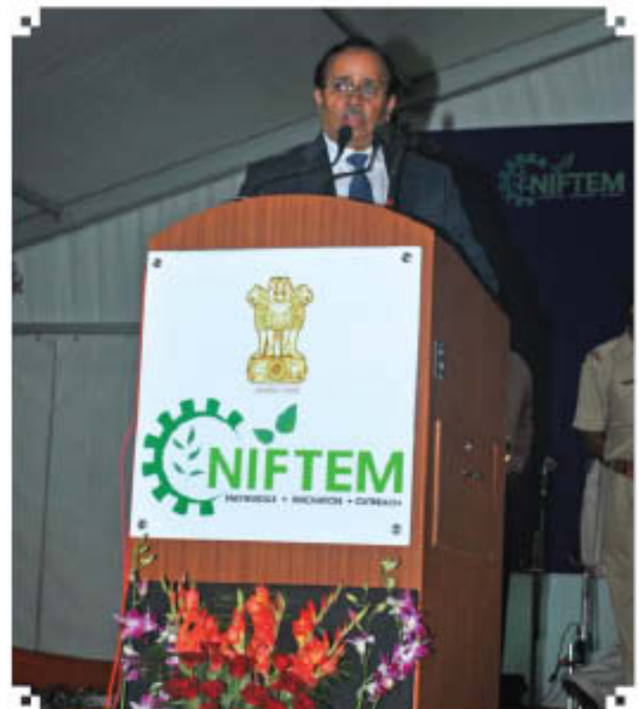
भारत के राष्ट्रपति के राष्ट्रीय मुख्यालय की मुद्रा, दिल्ली, हरियाणा