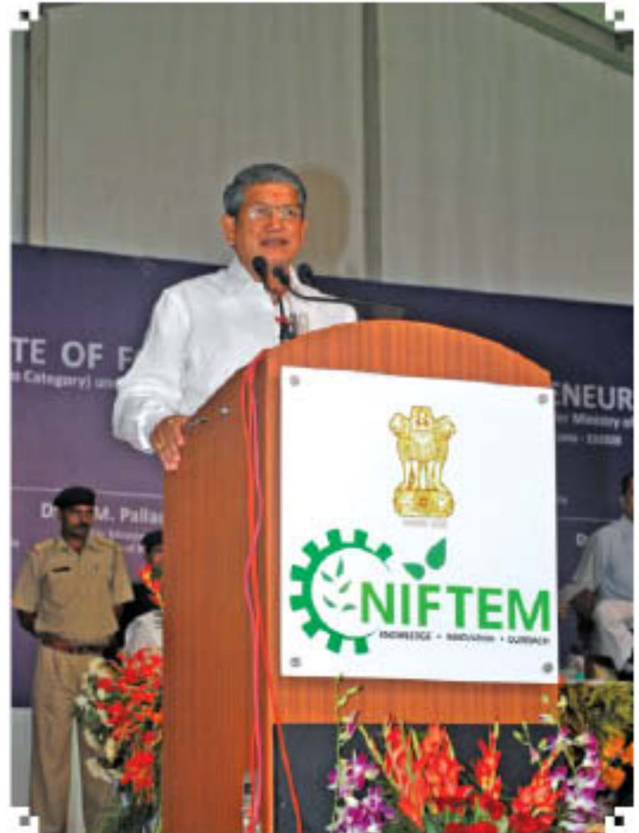
माननीय जल संसाधन मंत्री श्री तारिक अनवर अपना भाषण देते हुए