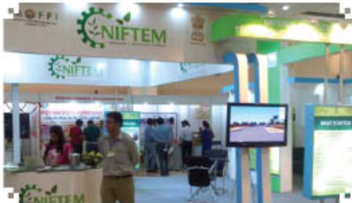
MSME Expo, Lucknow, Uttar Pradesh

Pahar Mahostava at Purulia and MSME Expo at Lucknow to promote and encourage the existing and new entrepreneurs to venture into food processing sector.