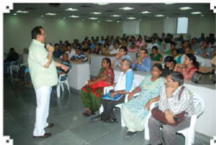
VC addressing students & their parents