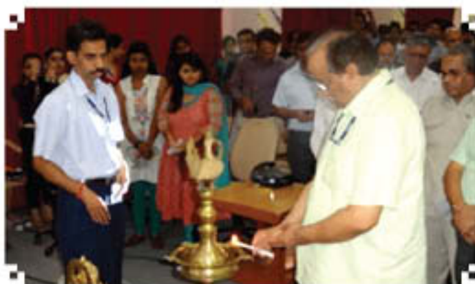
Vice Chancellor, NIFTEM Lighting the Lamp on Teachers' Day

philosopher and a guide to his students but never expects reciprocation. On this day, the students paid their honour to their teachers for their significant and selfless behavior. NIFTEM students expressed from their core of heart what they feel about their teachers. The students gave many splendid performances on the day right from classical dance to mimicry to guitar playing, the variety of which was unutterable. Suitable awards were given to the best performers.