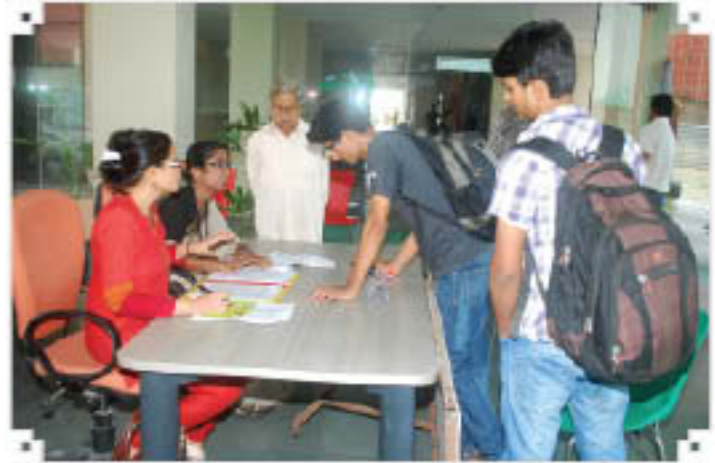
प्रवेश हेतु विद्यार्थियों की कौंसलिंग