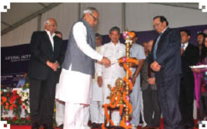
Lighting of Lamp by Shri Bhupinder Singh Hooda, Hon'ble CM, Haryana