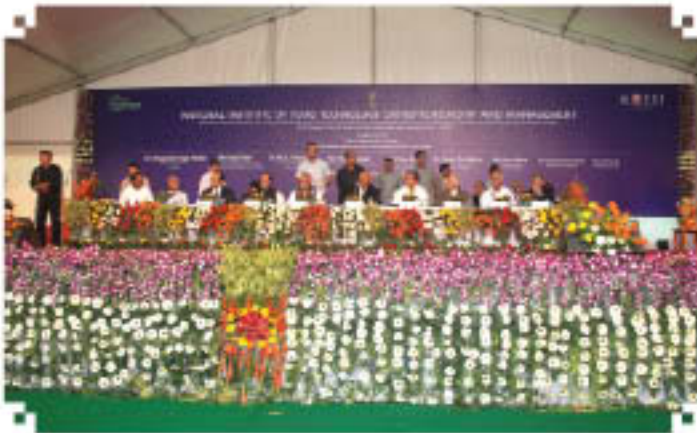
Inauguration of NIFTEM Campus on 7th November, 2012

Chief Minister, Haryana, Shri Harish Rawat, Hon'ble Minister of Water Resources, Shri Tariq Anwar, Hon'ble Minister of State for Agriculture and Food Processing Industries, Shri Arun Maira, Hon'ble Member, Planning Commission, Shri Jitender Singh Malik, Hon'ble Member of Parliament from Sonapat and Shri Jai Tirath, Hon'ble MLA from Rai.