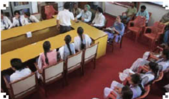
पंजोली कला ग्राम, पंजाब में उन्नत माध्यमिक विद्यालय में ग्रामीणी प्रतिनियुक्ता का संचालन करते हुए