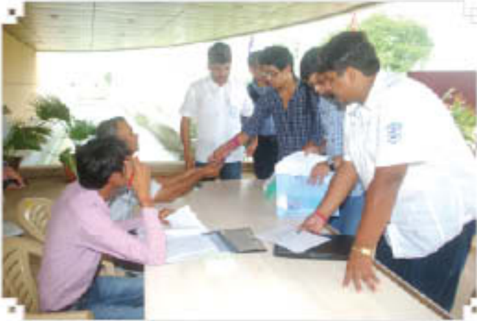
प्रवेश हेतु विद्यार्थियों की कौंसलिंग