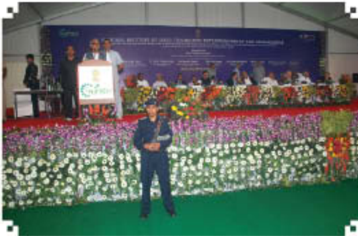
Shri Bhupinder Singh Hooda, Hon'ble CM, Haryana Delivering his Address

The Hon'ble Chief Minister, Haryana expressed his happiness to provide land for this prestigious Institution and was proud of having such an apex world class Institute in the State of Haryana. The Hon'ble Chief Minister also released the first Newsletter of the Institute.