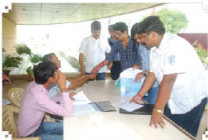
Counselling of students for admission