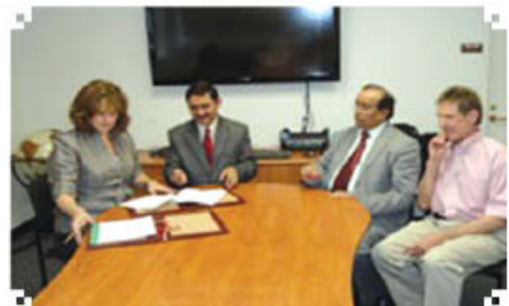
कानास राज्य विश्वविद्यालय मनहटन, संयुक्त राज्य अमरीका के साथ समझौता ज्ञापन पर हस्ताक्षर