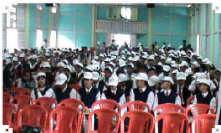
शिल्लोंग में आउटरीच कार्यक्रम