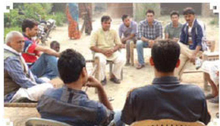
Discussion with Village Pradhan in Nagla Mohan Village, Uttar Pradesh