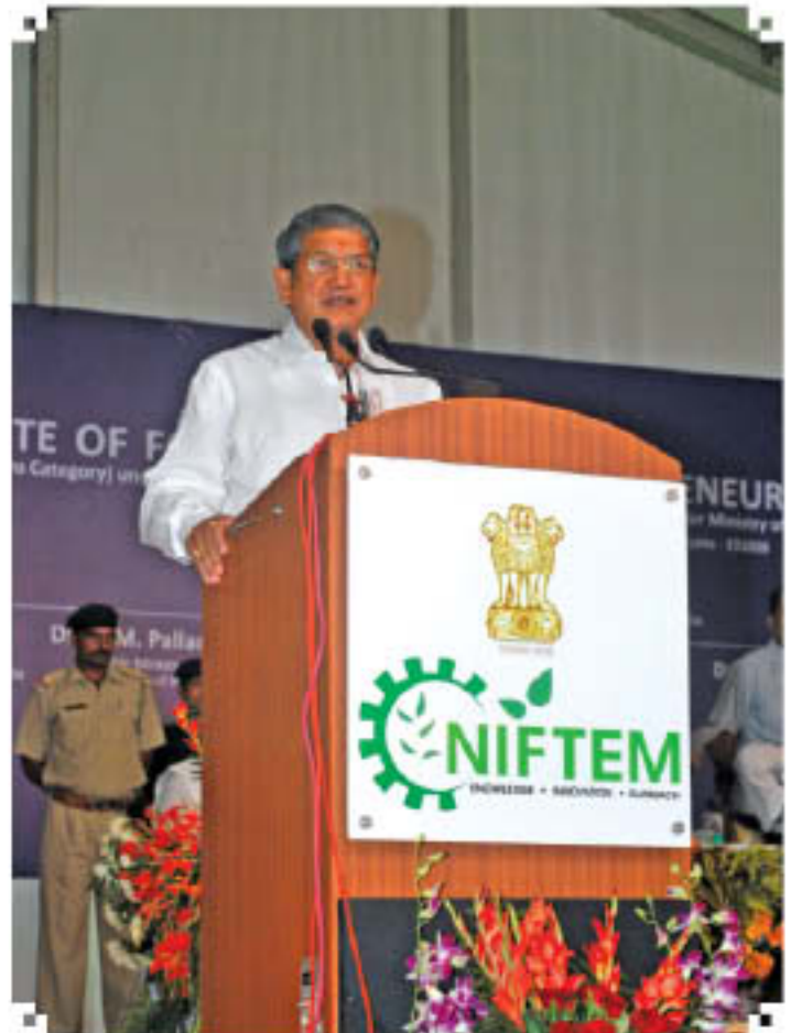
Shri Harish Rawat, Hon'ble Minister of Water Resources delivering his Address