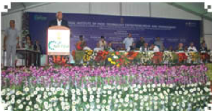
भारतीय कृषि एवं खाद्य प्रसंस्करण उद्योग मंत्री द्वारा उद्घाटन पत्र के उद्घाटन