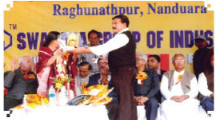
जय चंदी पट्टार महोत्सव, पुरलिया, पश्चिमबंगाल