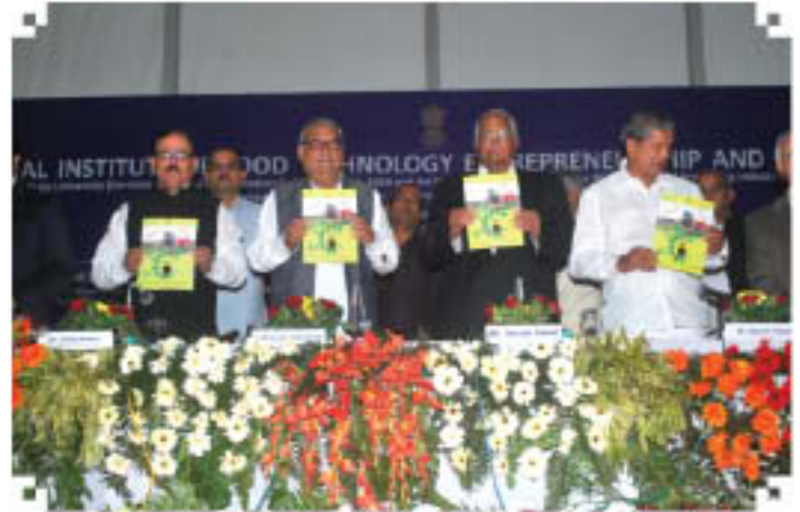
हरियाणा के राष्ट्रीय मुख्यालय की मुद्रा, दिल्ली, हरियाणा

संस्थान को राष्ट्र के प्रति समर्पित करते हुए माननीय कृषि एवं खाद्य प्रसंस्करण उद्योग मंत्री ने कहा कि संस्थान खाद्य उद्योग के लिए विशिष्ट उच्च गुणता शिक्षा तथा अनुसंधान कार्यक्रमों की पेशकश करेगा तथा कौशल की कमी को दूर करने के लिए अन्य महत्वपूर्ण क्रियाकलापों की व्यवस्था भी करेगा। उन्होंने आगे खाद्य प्रसंस्करण क्षेत्र की वौहिक आवश्यकताओं की पूर्ति हेतु निपटेम जैसी कई और संस्थाओं की आवश्यकता पर भी जोर दिया।