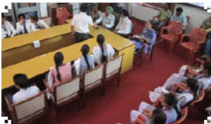
Conducting quiz competition in Higher Secondary School in the Panjoli Kalan Village, Punjab