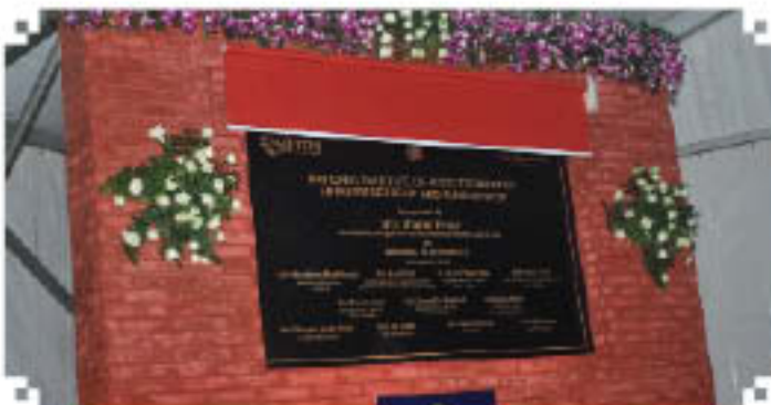
Unveiling of Inauguration Plaque by Hon'ble Minister of A & FPI

While dedicating the Institute to the Nation the Hon'ble Minister of Agriculture and Food Processing Industries has said that the Institute will offer high quality education and research programmes specific to the food industry and also provide other core activities to bridge the skill gap. He further emphasized the need for many more Institutions like NIFTEM to meet the intellectual requirements of Food Processing Sector.