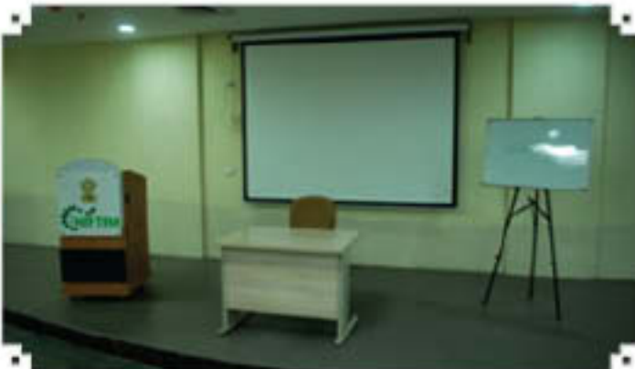
100 सीटों वाला कक्षाकक्ष

प्रणालय, व्याख्यान अभिलेखन तथा श्रव्य प्रणाली है। यह अधिगम प्रक्रिया के वर्धन में सहायक होगी तथा त्रि-आयामी संकल्पन के माध्यम से जटिल संकल्पनाओं को समझने में विद्यार्थियों की सहायता करेगी।