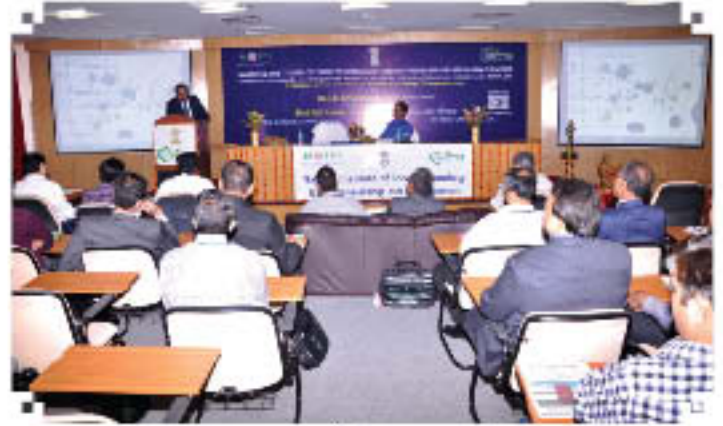
उद्घाटन सत्रांश (29 अक्टूबर, 2012)