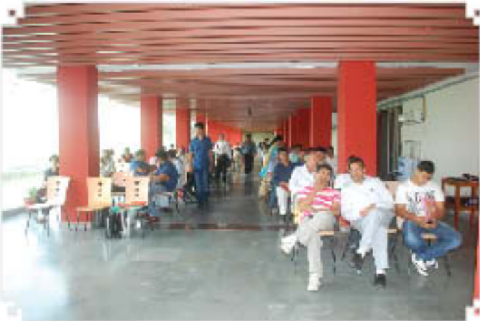
प्रवेश हेतु विद्यार्थियों की कौंसलिंग