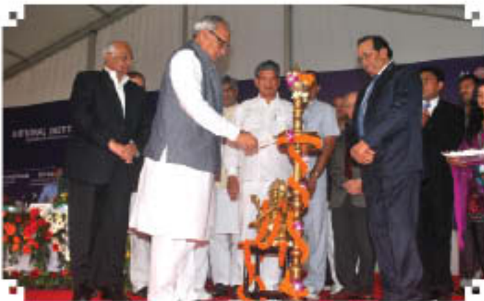
हरियाणा के माननीय मुख्यमंत्री श्री भुषिंदर सिंह हुडा द्वारा दीप प्रज्वलित