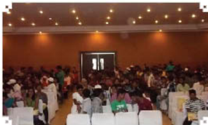
Outreach Programme at Bhubneswar