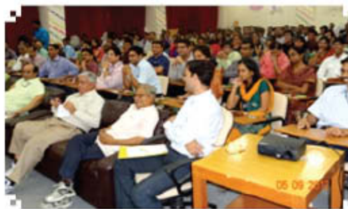
NIFTEM Students and Teachers