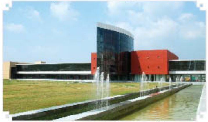
निएटेम का ज्ञान केन्द्र (पुस्तकालय खंड)