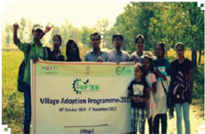
NIFTEM Village Adoption poster rally in Gulzarpur, Udham Singh Nagar, Uttarakhand