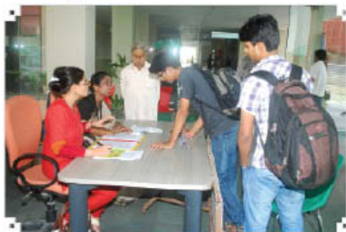
Counselling of students for admission