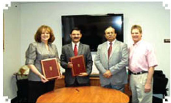
कानास राज्य विश्वविद्यालय मनहटन, संयुक्त राज्य अमरीका के साथ समझौता ज्ञापन पर हस्ताक्षर

निपटेम ने संकाय/विद्यार्थी विनिमय कार्यक्रम अनुसंधान तथा साझे हित के अन्य मामलों के क्षेत्र में पारस्परिक सहयोग हेतु बेनेजिन विश्वविद्यालय, दि नीदरलैंड्स तथा कंसास राज्य विश्वविद्यालय मनहटन, संयुक्त राज्य अमरीका के साथ समझौता ज्ञापन निष्पादित किए हैं। संस्थान द्वारा नेबरासका विश्वविद्यालय, लिंकन, संयुक्त राज्य अमरीका तथा यू.के, फ्रांस, ब्राजील इत्यादि के कुछ और विश्वविद्यालयों के साथ इसी प्रकार के समझौता ज्ञापन पर हस्ताक्षर करने की संभावना है।