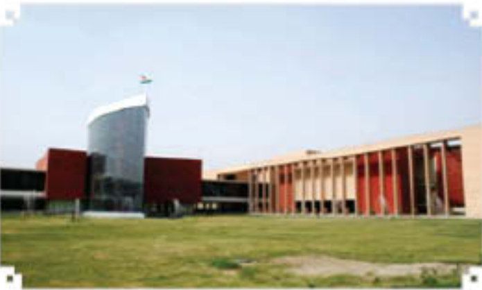
संगोशिला तथा पुस्तक खंड