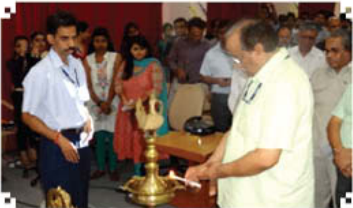
शिक्षक दिवस को शीप प्रान्तगतित करते हुए निपटेम में उपकुलपति

होता है। शिक्षक अपने विद्यार्थियों का सच्चा मित्र, दार्शनिक तथा मार्गदर्शक होता है किन्तु वह बदले में कोई आशा नहीं रखता। इस दिन विद्यार्थी अपने अध्यापकों के प्रति उनके महत्वपूर्ण तथा स्वार्थ रहित व्यवहार के लिए सम्मान प्रकट करते हैं। निपटेम के विद्यार्थियों ने शिक्षकों के बारे में अपने हार्दिक उद्गार प्रकट किए। विद्यार्थियों ने इस दिन शास्त्रीय नृत्य से लेकर मिमिकरी तथा गिटार वादन जैसे आलीशान प्रस्तुतीकरण किए। इन प्रस्तुतीकरणों की विविधता अकथनीय थी। सर्वोत्तम निष्पादनकर्ताओं को उपयुक्त अवार्ड दिए गए।