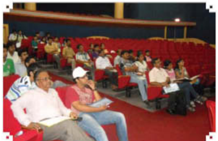
Outreach Programme at Bhopal