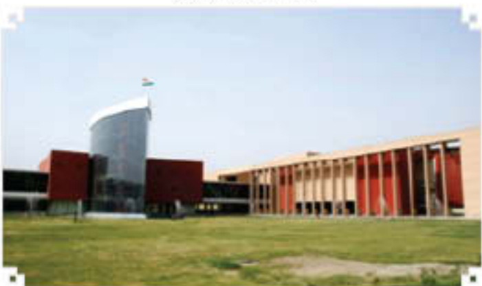
Seminar and Library Blocks