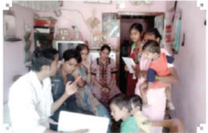
House to House survey in Village Kurhe (Panache), Jalgaon, Maharashtra