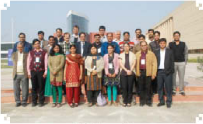
प्रतिभागियों का समूह चित्र (8-10 दिसम्बर, 2011)