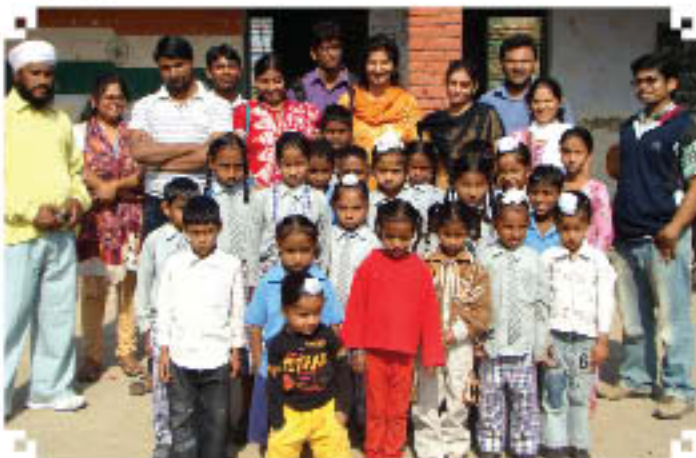
शेरा भीरा गाँव, उत्तरप्रदेश, पंजाब के प्राथमिक विद्यालय में निपटेम टीम का दौरा