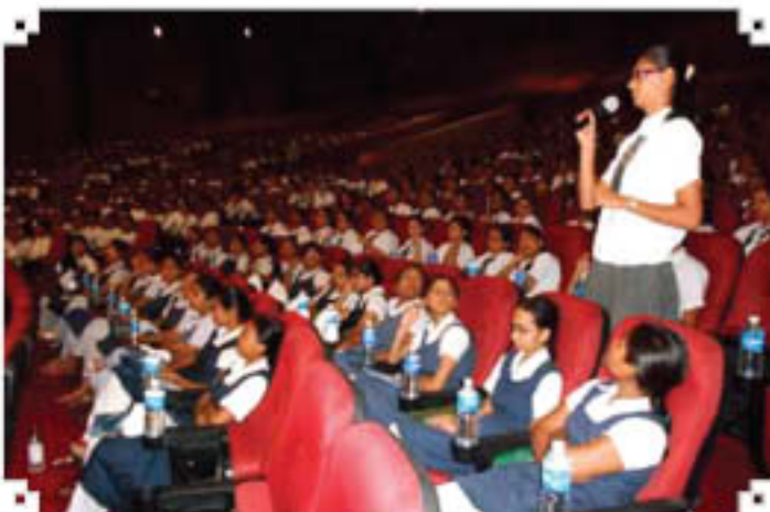
Outreach Programme at Baroda