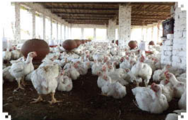
Poultry farm in Village Aika, Fatehabad, Haryana

The next visit is slated for February, 2013. In each academic year two such visits shall be undertaken by NIFTEM students and faculty.